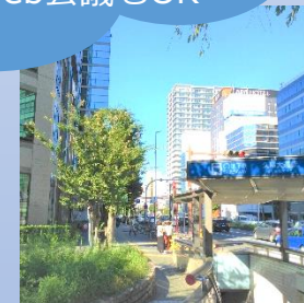
久屋大通駅徒歩4分