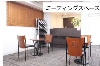
ミーティングスペース